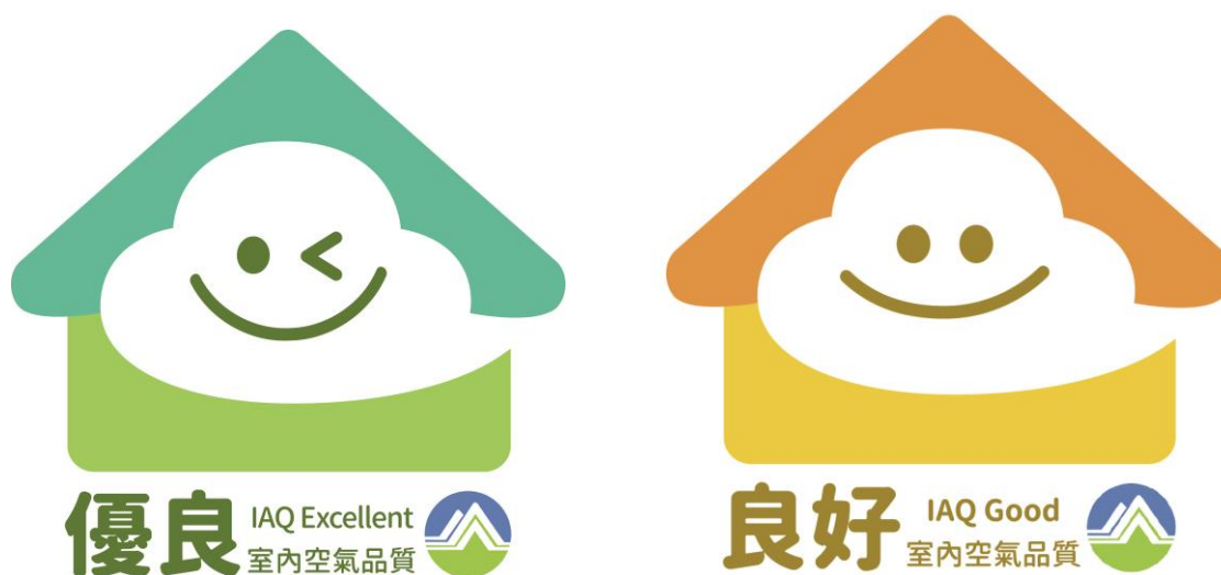
圖10 室內空氣品質自主管理標章 優良級(左)、良好級(右)

本要點明定公私場所之自主管理標章分級、申請、審查、使用管理等事項，詳見附件一所示。凡申請標章，應營造優質室內空氣品質，據以執行維護管理計畫，並委請環保署認可之檢驗測定機構依「公告場所室內空氣品質檢驗測定管理辦法」進行檢測後，出具合格檢測報告，可申請標章，如符合本要點規定，經直轄市、縣（市）主管機關審查同意後，將授予標章使用權，並可張貼標章於場所出入口，提高企業品牌形象。標章申請流程及標章規範如圖11及圖12所示。