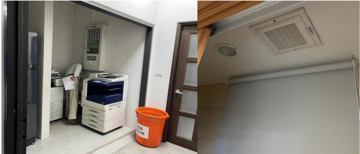
圖7 影印機及排風扇設置 (示意)